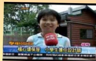
楊心環保屋 小學生擔任設計師