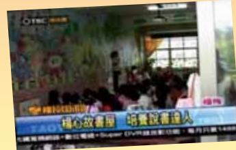
楊心故事屋 培養說事達人