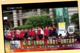
楊心國小金牌楊梅 和畢業生一起開花結果