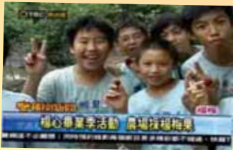
楊心畢業季活動 農場採楊梅果