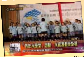
楊心合唱團參與《百年水學堂》 表演水資源教育紮根