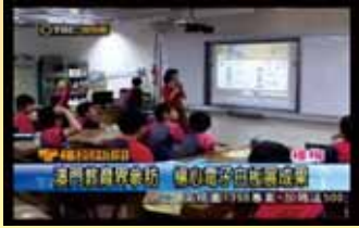
澳門教育界參訪 楊心電子白板展成果