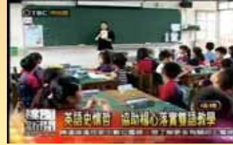
英語史懷哲協助楊心 落實雙語教學