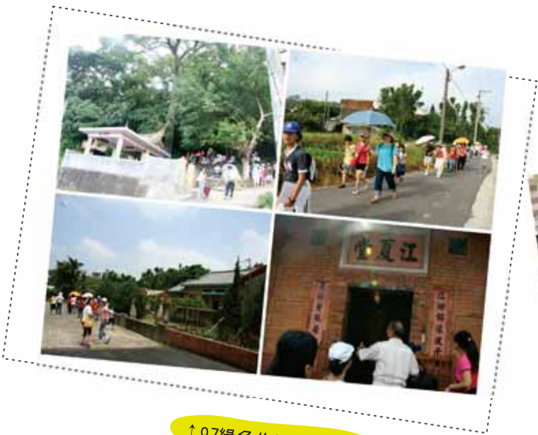
↑ 97綠色生活地圖踏查