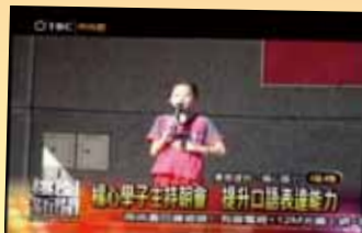
楊心學子主持朝會 提升口語表達能力