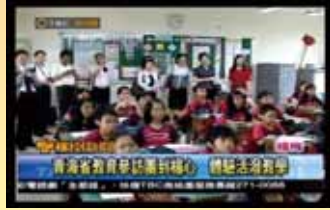
青海省教育參訪團 到楊心體驗活潑教學