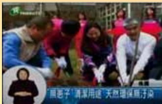
楊心植無患子樹 落實生活環保