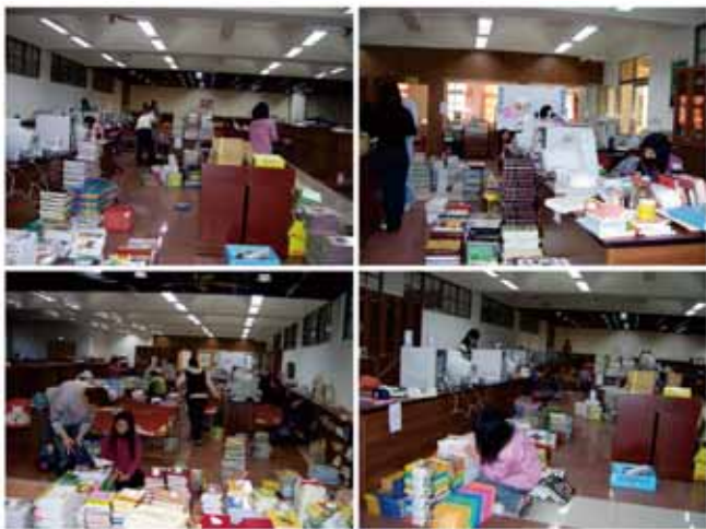
← 94新竹師院學生協助整理圖書館