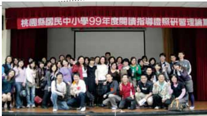
↑ 99教師參與閱讀指導研習