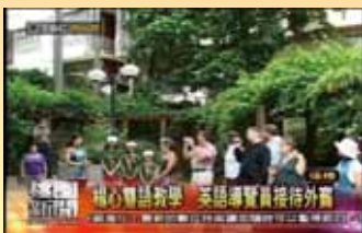
楊心雙語教學英語導覽員接待外賓 (美國能源教育基金會)