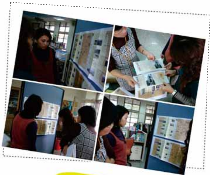
↑ 97綠色生活地圖設計