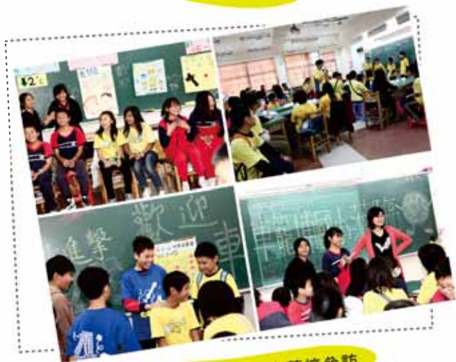
↑ 99車籠埔國小蒞校參訪