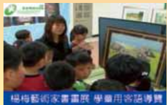
慶祝十週年校慶，辦理楊梅藝術家書展， 學童用客語導覽